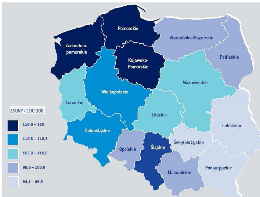
Rycina nr 1. Rozkład geograficzny umieralności na nowotwory złośliwe.