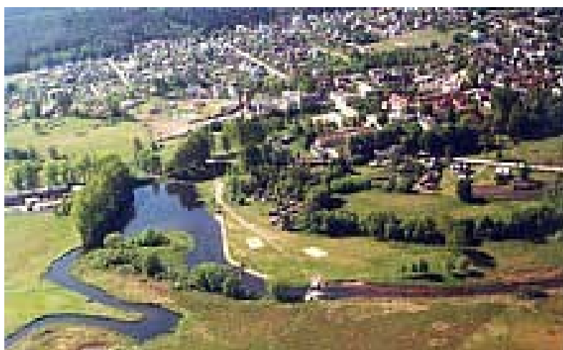
Rycina nr 3. Panorama Supraśla oraz doliny i rzeki Supraśli z „lotu ptaka”

Supraśl, co ma istotne znaczenie dla rozwoju turystyki oraz uzdrowiska, otaczają przepiękne lasy Puszczy Knyszyńskiej. Samo miasteczko przecina Dolina Supraśli, z leniwie płynącą, czystą rzeką, nazywaną niegdyś także Sprząślą, której źródła wypływają na wysokości 151 m n.p.m. wśród bagien Wysoczyzny Białostockiej, kończąc bieg w rzece Narwi.