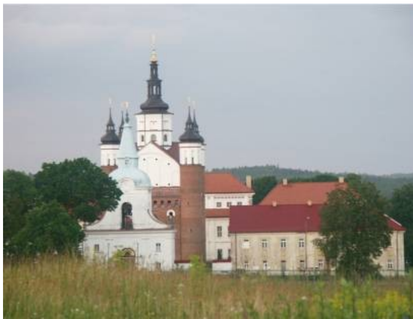
Rycina nr 5. Widok na Monaster, dawny Klasztor Bazylianów w Supraślu

umacnianie jego gospodarczej pozycji. Bazylianie handlowali nawet z takimi znanymi ośrodkami ówczesnej Europy jak Gdańsk czy Wilno. Wszechstronność gospodarcza mnichów pozwalała im na czerpanie dochodów nie tylko z posiadanych manufaktur, ale także gospodarki leśnej. Nie tylko jednak działalność gospodarcza wyróżniła działalność Zakonu i samo miasto Supraśl. Klasztor przez lata stanowił istotny ośrodek rozwoju kultury, w tym ze szczególnie znaną, bogatą w zbiory biblioteką oraz nie mniej słynną drukarnią (1696-1803), wyposażoną od 1710 r. we własną papiernię.