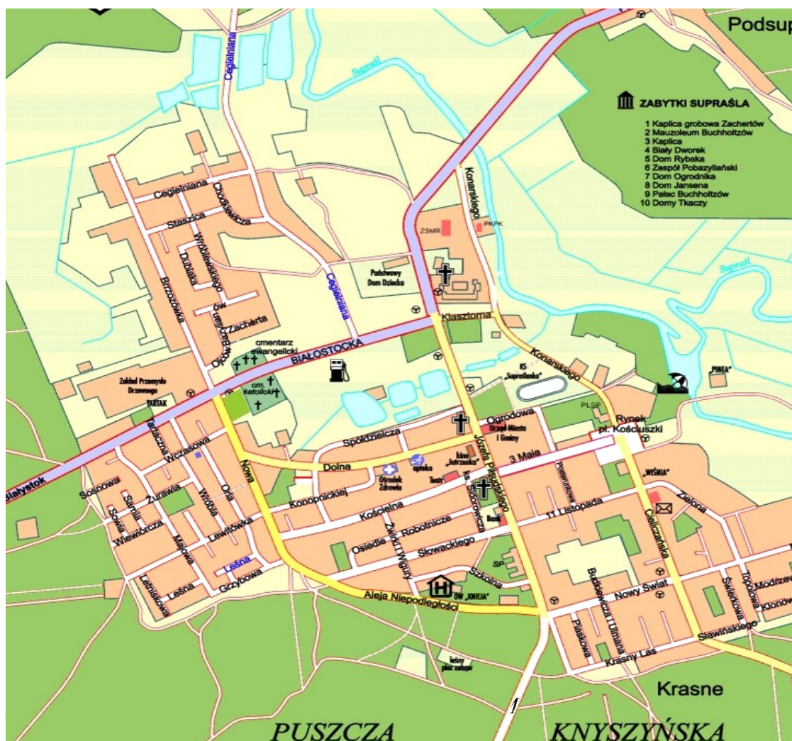
Rycina nr 6. Plan Supraśla

Kolejny okres znacznego rozwoju terytorialnego to lata sześćdziesiąte i siedemdziesiąte XX w., kiedy to m.in. na dawnych polach zachertowskich między ul. Piłsudskiego a ul. Żwirki i Wigury powstały zabudowania ul. Słowackiego. Domami mieszkalnymi zapełniły się też tereny nad dawnymi stawami klaszternymi wzdłuż strumyka Grabówka. Ostatnim zwartym terenem do zabudowy mieszkalnej jest północno-zachodnia część Supraśla, rozciągająca się od ul. Cegielnianej do granicy lasu, gdzie w ostatnich latach powstaje nowe osiedle mieszkaniowe. Dalsza ekspansja terytorialna miasteczka nie jest możliwa – skutecznie ją hamuje rozciągająca się wokół Puszcza Knyszyńska.