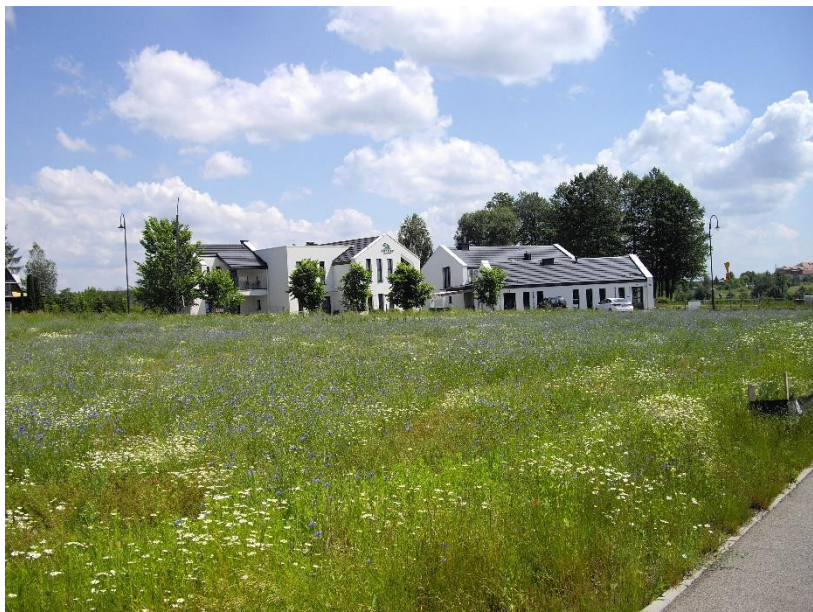
Rys. 12. Łąka w rejonie ul. Rymarka