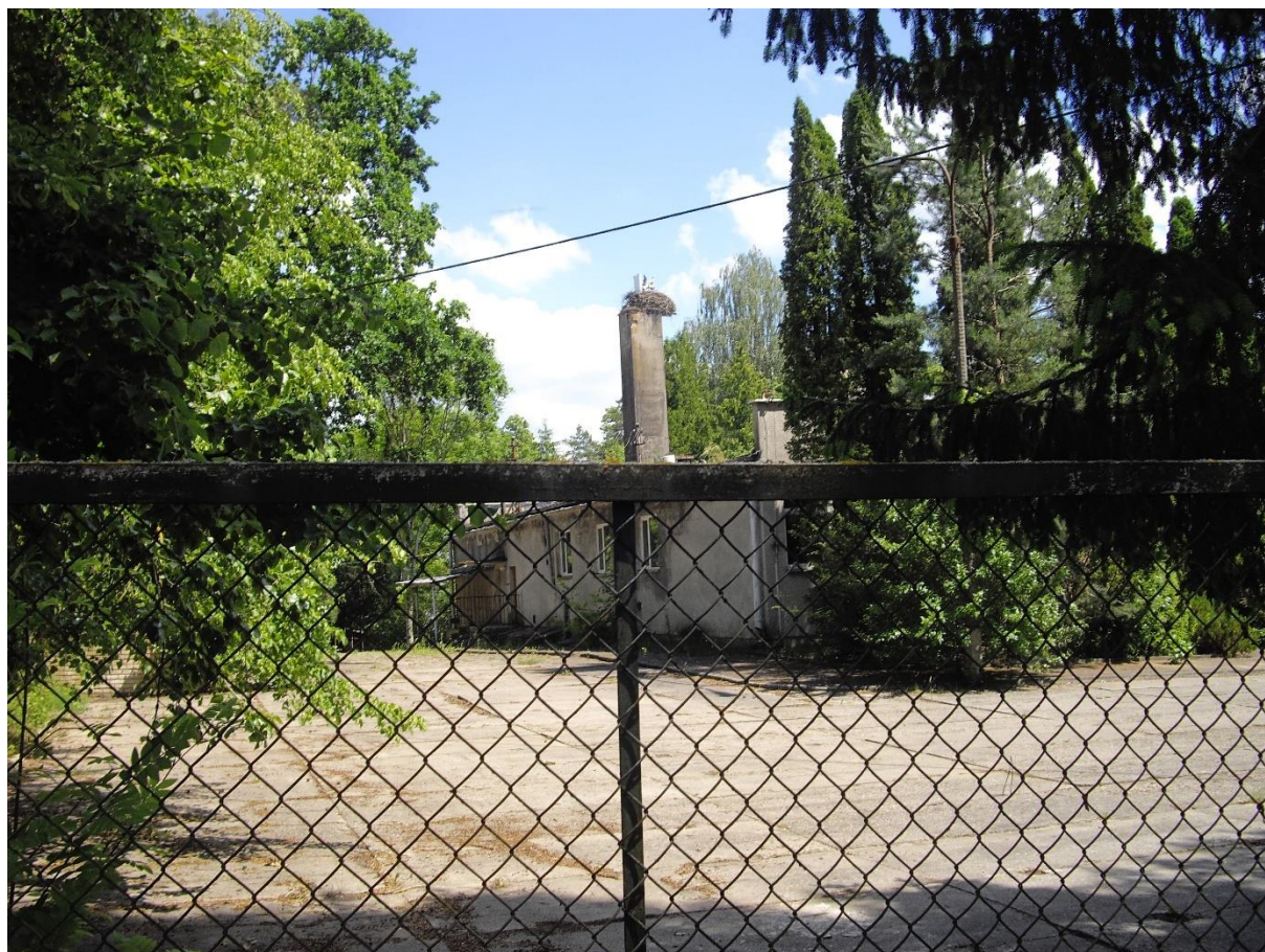
Rys. 12. Gniazdo bocianie na kominie obiektu zlokalizowanego na terenie dawnego ośrodka wczasowego „Puszcza”