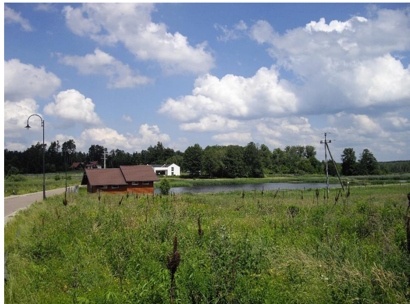
Rys. 10., 11. Zielen w rejonie stawów