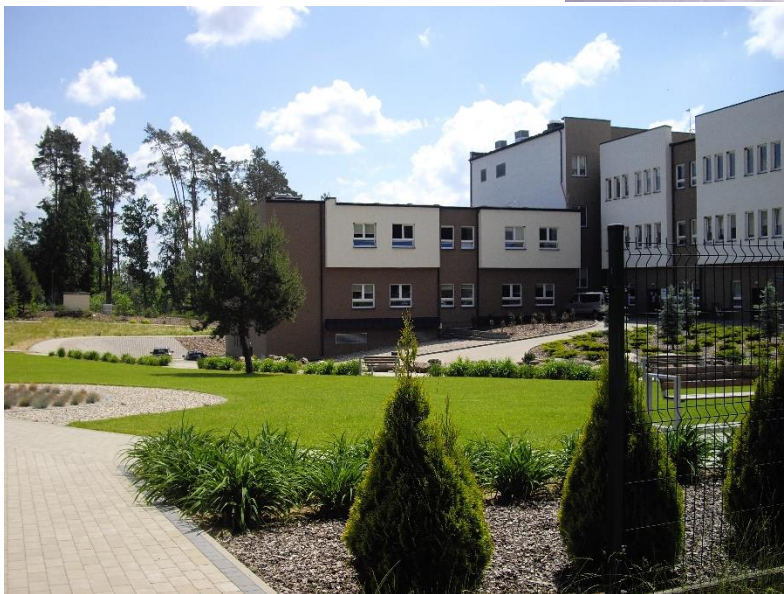
Rys. 2., 3., 4. Przykłady zieleni urządzonej na obszarze opracowania