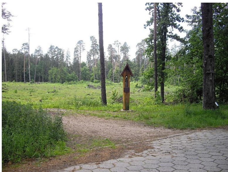
Rys. 5., 6., 7., 8., 9. Lasy na obszarze opracowania