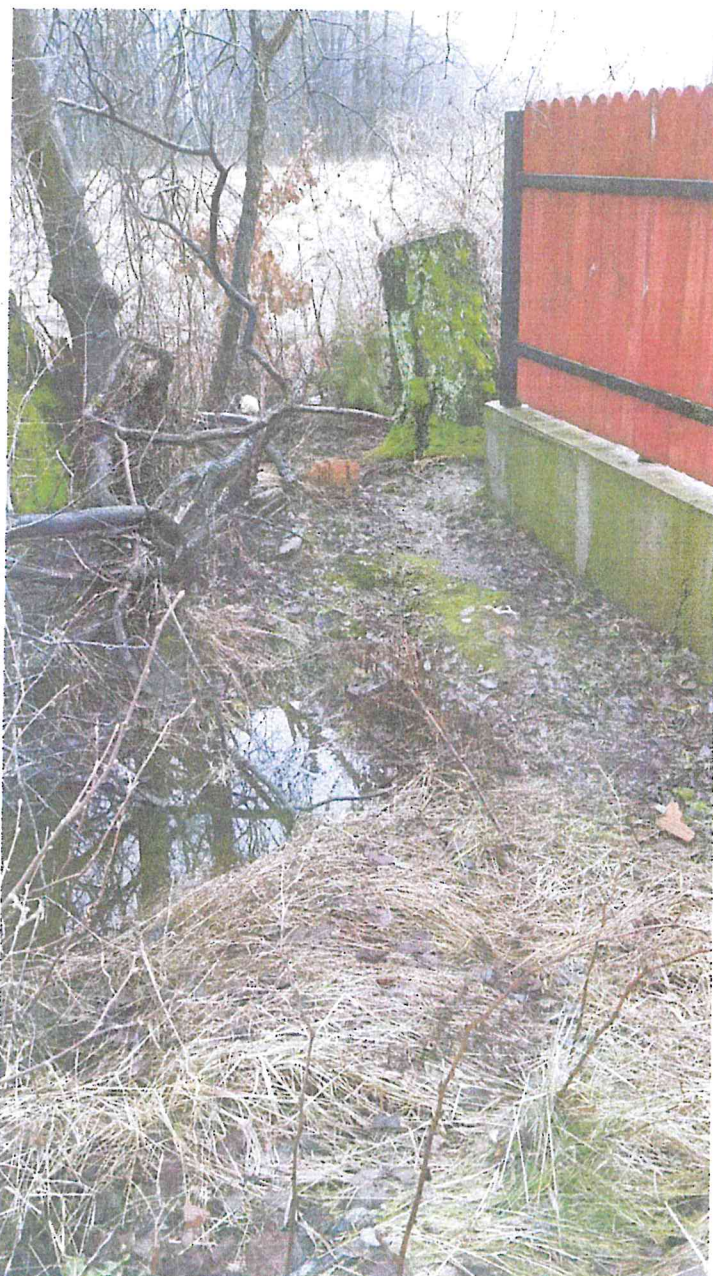
Fot. 5 Brak widocznego odpływu wody pomiędzy dz. nr 62 , dz. nr 61/9 w Zaściankach