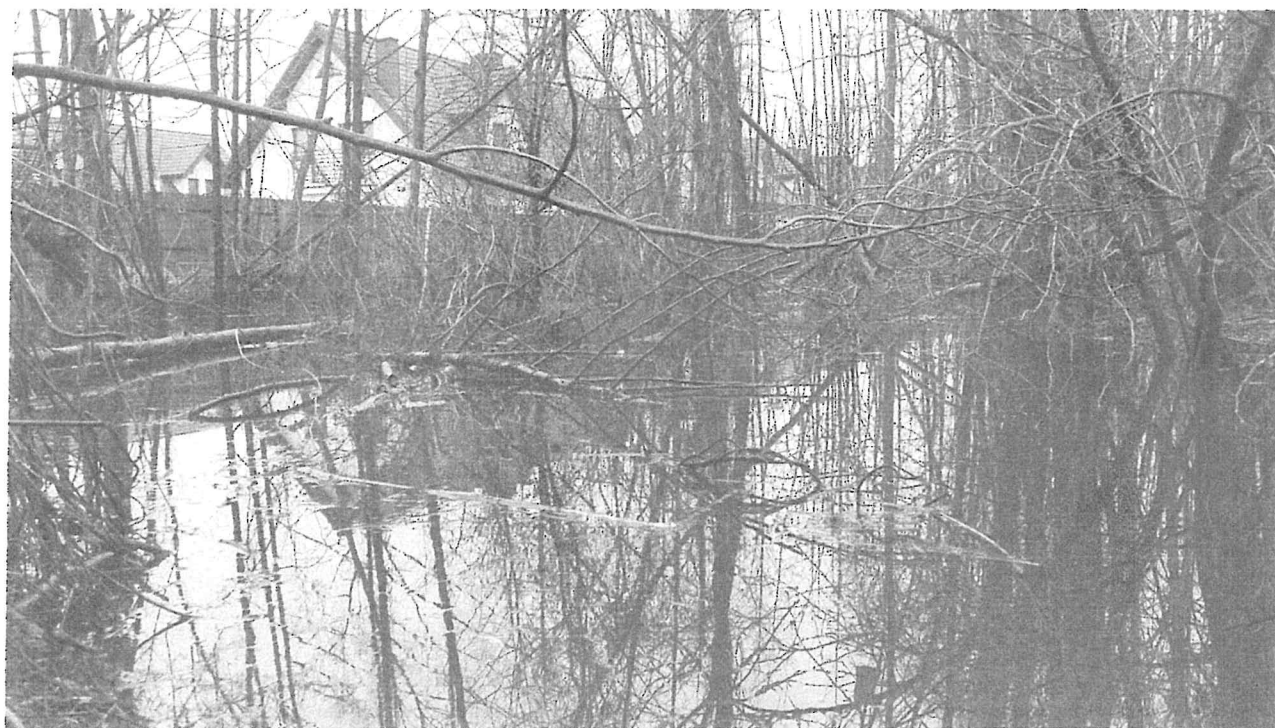
Fot. 4 „Rów melioracyjny” - rozlewisko wody przy ulicy Szlacheckiej – dz. nr 62