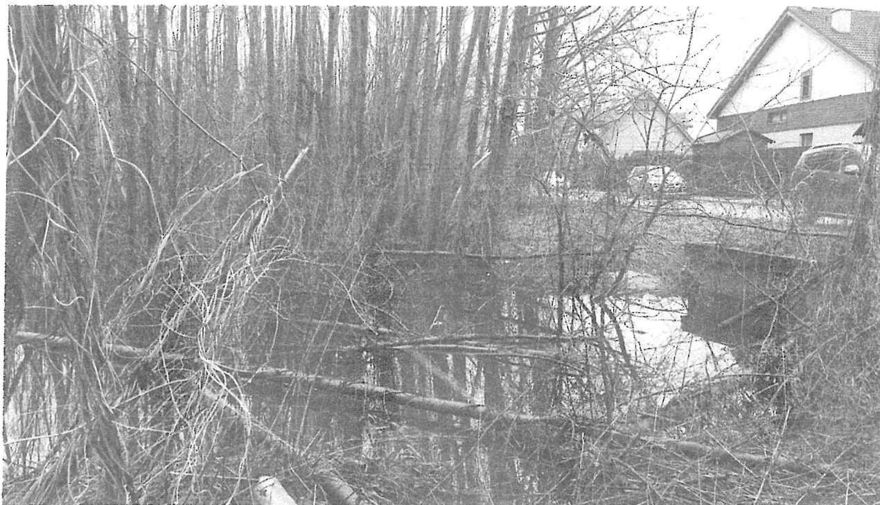
Fot. 3 „Rów melioracyjny” - rozlewisko wody przy ulicy Szlacheckiej – dz. nr 62