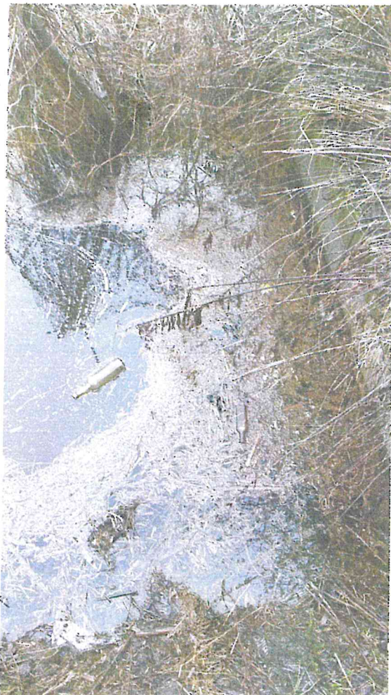
Fot.1 Przepust pod ul. Szlachecką – jedna strona.