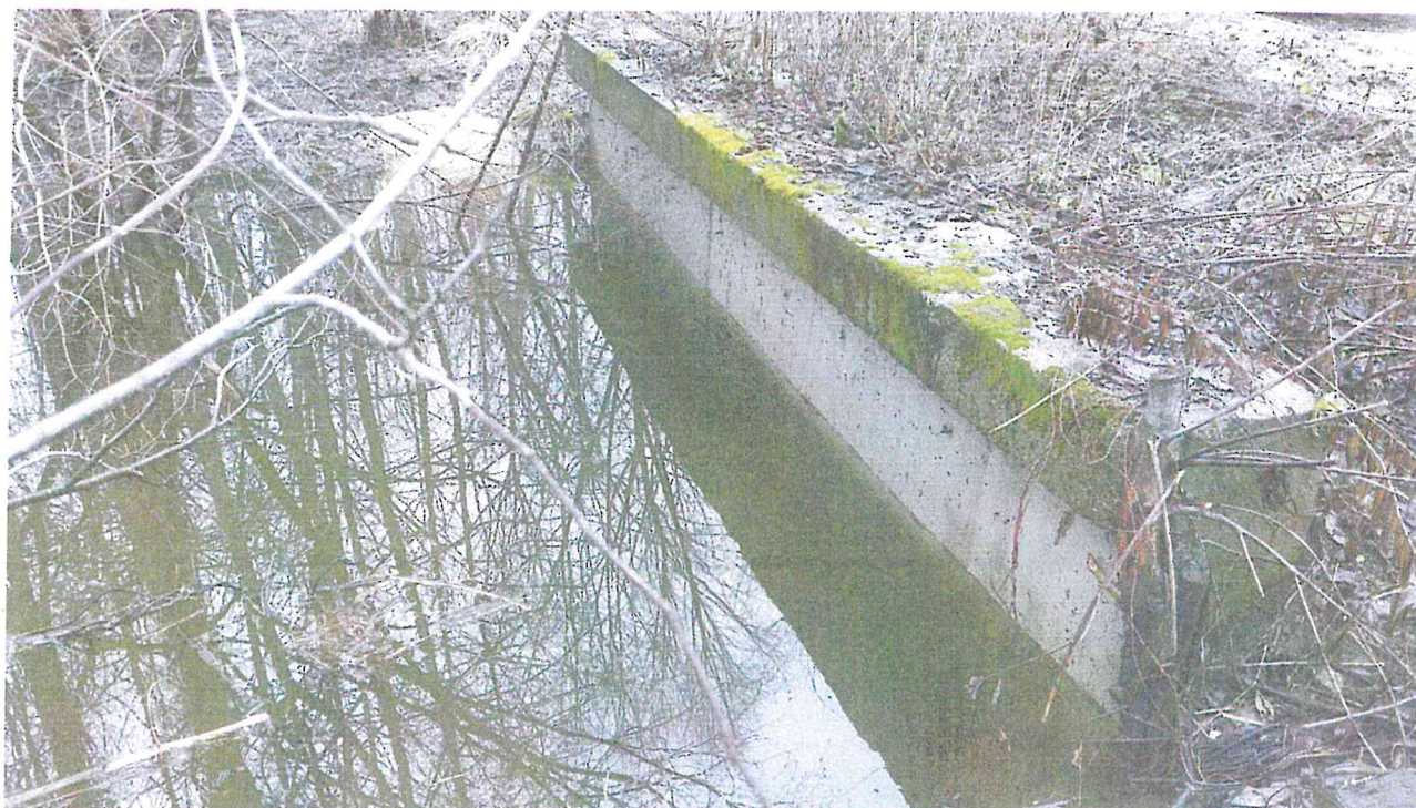
Fot. 2 Przepust pod ulicą Szlachecką – druga strona